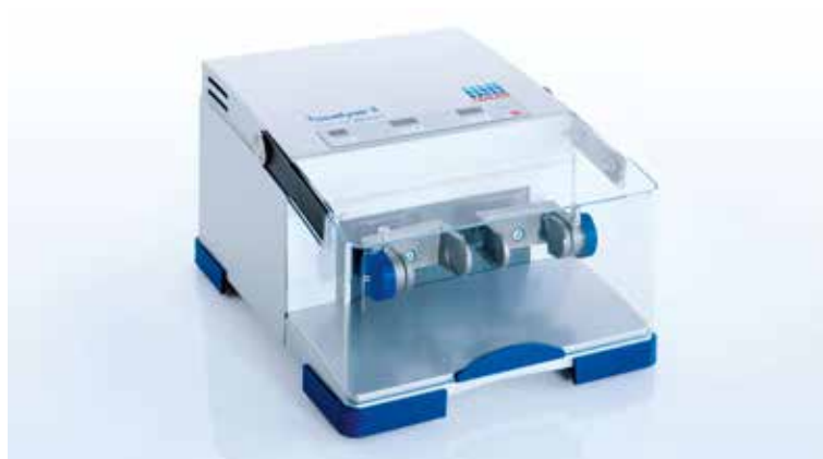
キャンペーン製品: TissueLyser II

多数の生体サンプルから、DNA、RNAおよびタンパク質の遊離を容易に行うハイスループットタイプの破碎システムです。ビーズによる破碎法は組織を破碎するのみならず、細胞ライセートの粘性を剪断することができ、核酸の収量向上に有効です。